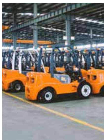
▶ 车:点检、维保、效率等