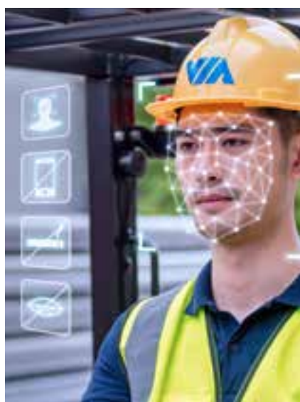
▶ 人:驾驶员行为分析及预警

以AI边缘算法为基础,通过软硬件一体化WorkX叉车车队管理系统,帮助车队管理者实时了解车队的运营情况,提升驾驶安全,降低营运成本,提高管理效率。